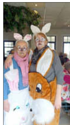
Die Osterhasen

Auf der Rückfahrt war im Hafen Freest ein geplanter Stopp vorgesehen, um ein paar „Hasenbrötchen“, einen frühen Abendimbiss, einzunehmen. Anschließend wollten wir frisch gestärkt die letzte Etappe nach Hause antreten. Dazu musste der Bus wenden. Und dann passierte