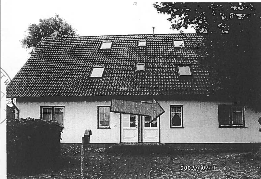
↑ Bild 2: Blick auf die Vorderseite (Nordostseite) des Gebäudes, in dem sich das Bewertungsobjekt befindet