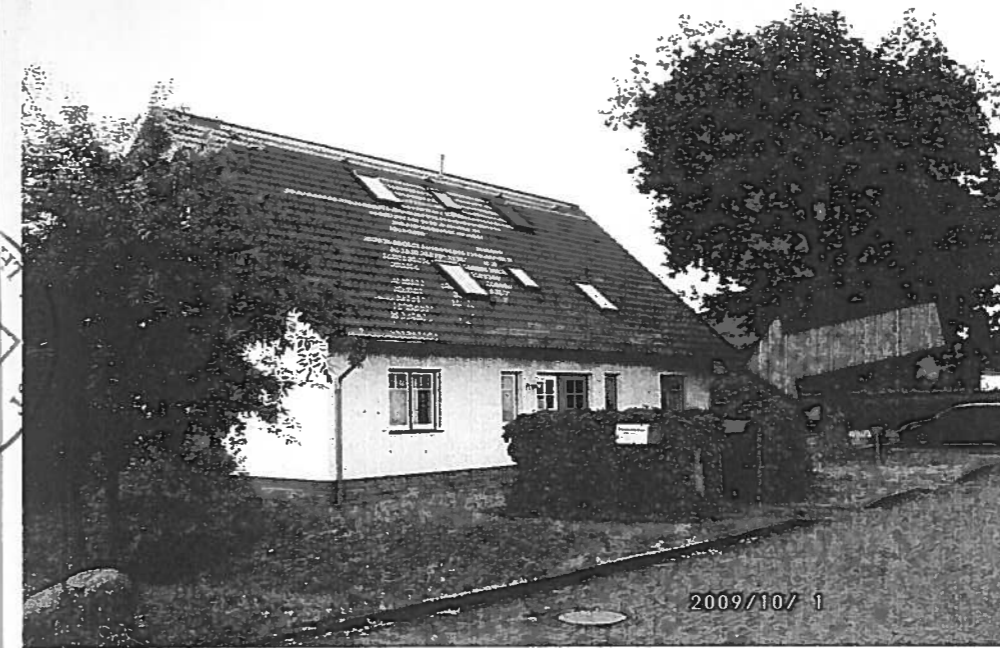
↑ Bild 1: Blick von der Gartenstraße (aus Richtung Südosten) auf das Gebäude, in dem sich das Bewertungsobjekt befindet

an die Gemeinde-/Stadtafel geheftet am: von der Gemeinde-/Stadtafel abgenommen am: