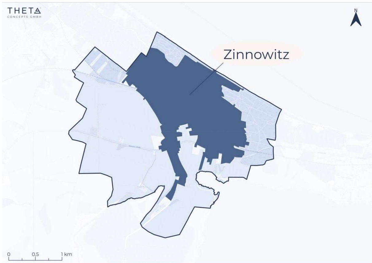
Abbildung 1: Planungsgebiet mit Ortslagen

Das Ostseebad Zinnowitz liegt im Osten des Landkreises Vorpommern-Greifswald in Mecklenburg-Vorpommern auf der Insel Usedom. Die Gemeinde erstreckt sich über eine Fläche von rund 9 km 2 und umfasst ausschließlich die Ortslage Zinnowitz. Insgesamt leben in der Gemeinde 3.806 Menschen (Stand: 30.06.2024). Abbildung 1 veranschaulicht das Planungsgebiet.